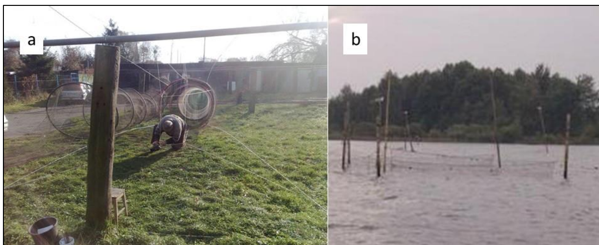
Rys. 15. Żaki stosowane na jeziorze Dąbie, a – szycie żaka, b – widok żaka rozpostartego na wbitych w dno tyczkach